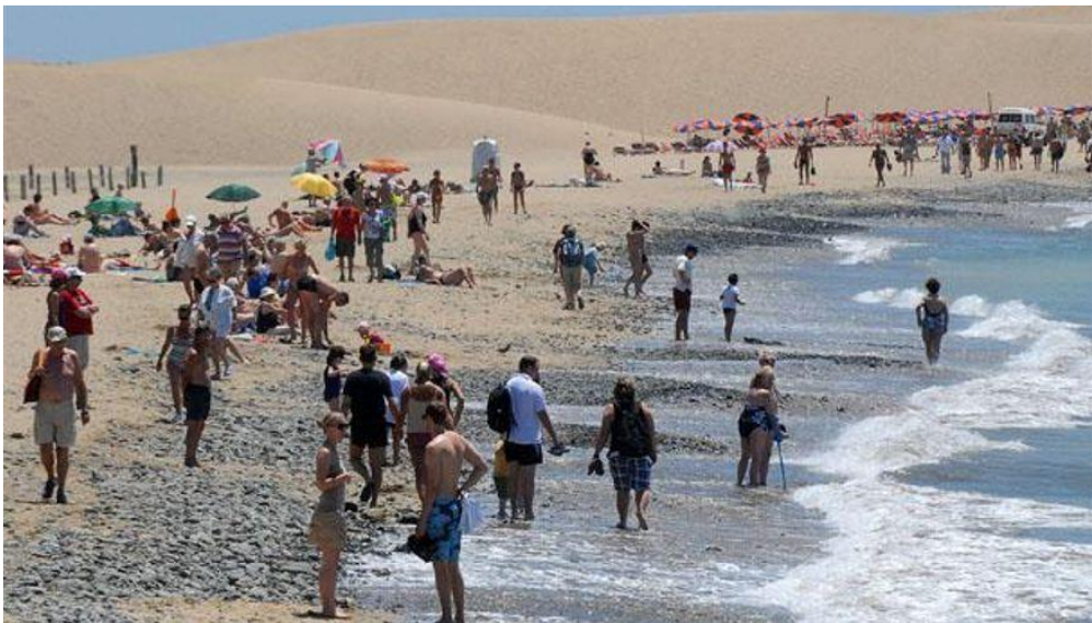
Turistas en la zona de Maspalomas más cercana a la Charca. SANTI BLANCO

Las Palmas de G.C. | 11-04-22 | 11:16 | Actualizado a las 11:21